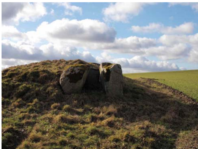
Kammeret mod øst i kanten af højen.