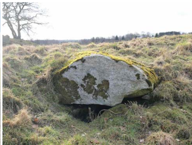
Kammeret midt på højen