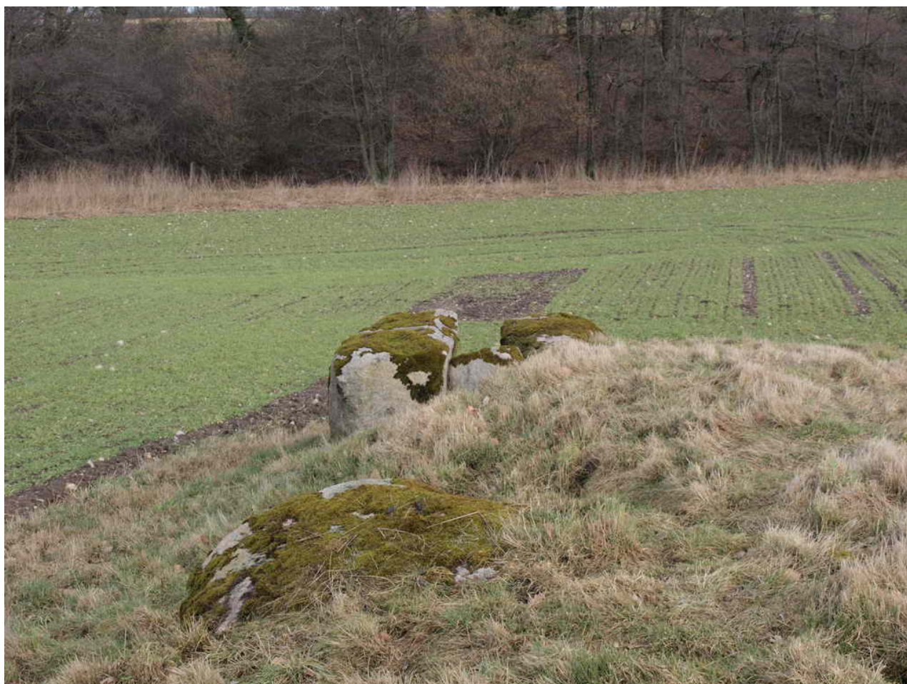
Når man står midt på højen og ser mod øst mod lavringe å, ser man først overliggeren fra det midterste kammer og derefter kammeret i den østlige kant af højen.